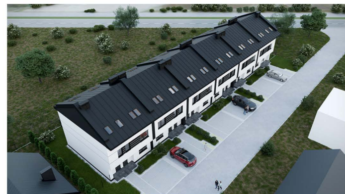
Widok osiedla z lotu ptaka