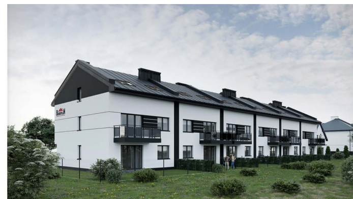
Widok osiedla od strony ogrodu

Funkcjonalne wnętrza o wysokim standardzie